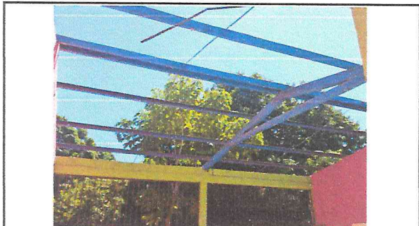
Cambio de estructura metálica en proceso