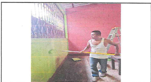
Pintura de paredes en proceso.

Observación: Si es necesario se pueden agregar hojas adicionales y actualizar el número de hojas.