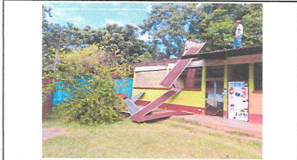
Cambio de lámina por lámina troquelada en proceso