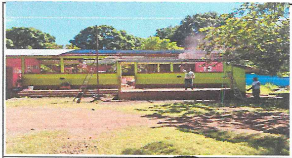
Mantenimiento de estructura metálica en proceso