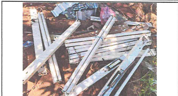
Cambio de lámparas en proceso